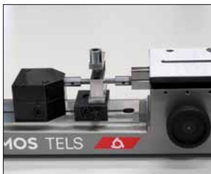
Mesure de longueurs (TELS50, TELS5, TELS5.1)