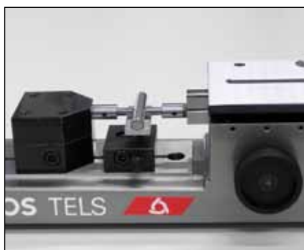
Mesure de diamètres extérieurs (TELS50, TELS5, TELS5.1)