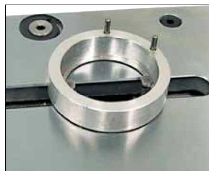
Mesure de gorges intérieures (TELS10)