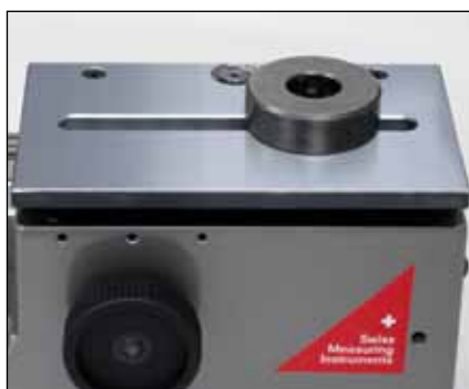
Mesure de diamètres intérieurs (TELS10)